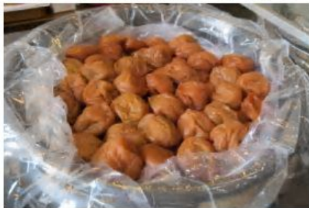
見てるだけですっぽそう 店内には厳選された梅干が ツボに入って並んでいます。