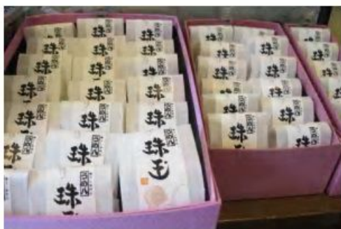
うめ八さんイチ押しの商品 「珠玉」 6コ入り ¥1596- 12コ入り ¥3087-