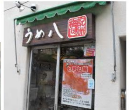
店内では長椅子もあり ゆっくり梅干の説明もして くれます