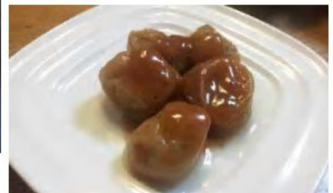
とまと梅をいただきました。 冷酒にバッチリです60g ¥398-