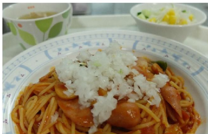
八王子ナポリタン「はちなぽ」 ¥530