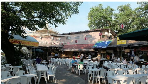
合計800人収容（雨天時は200～300人）できる会場。ハイシーズンは大変な盛り上がりです。