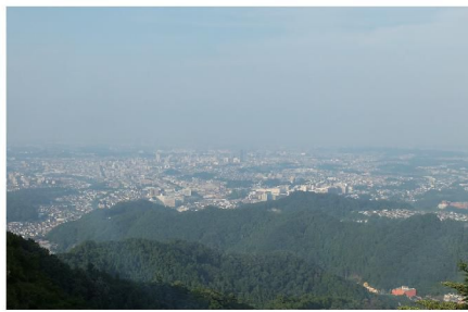
晴れた夜は東京の夜景をたっぷり味わえる贅沢なロケーション