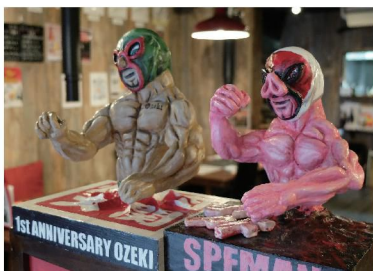
お店のマスコットのマスクマンがお出迎え！