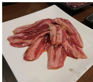
どの部位を食べても喰ること間違いナシです