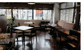
ゆっくりくつろげる落ち着いた店内