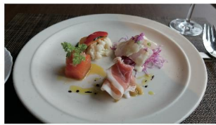
前菜料理はいろいろな味が楽しめます