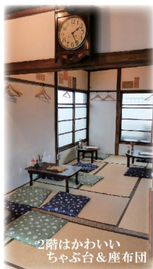
2階はかわいいちゃぶ台&座布団