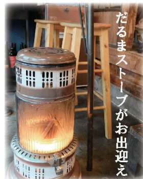
だるまストーブがお出迎え

ディナーは一転、自然派ワインをメインに頂くお料理が盛りだくさん。ワインは赤・白合わせて常時20種くらいを取り揃え。肴になるお料理は肉も魚もやさしくアレンジされていて、どのお皿もスッと口に馴染みます。お好みのワインをボトルで注文し、それに合わせて肴をチョイスするのも良いですね♪昼夜それぞれに用意された飲み物と食事、そして居心地の良い雰囲気なかで仲間と楽しんではいかが？