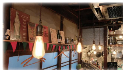
夜になるとこの電球の明かりが暖かく店内を照らします