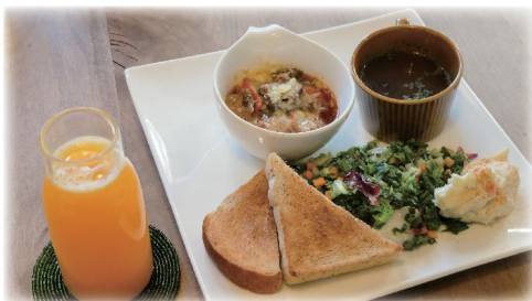
野菜たっぷりのBランチ ¥1,000 搾りたてオレンジジュース ¥550