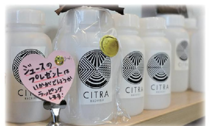
ジュースのおみやげも出来ます 大切な人へのプレゼントにもどうぞ