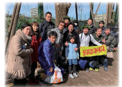
ランナー&サポーターと記念撮影！