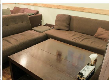
店内奥にはソファ席もあり、ゆっくりくつろぐにはもってこいの空間です!