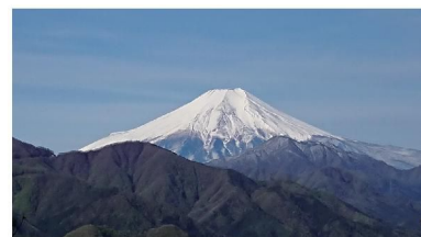
高畑山からの富士山

大型連休、いかがでしたか?? ラジオによると10連休を取っている方は労働人口の約1/3ということでした。これだけの休日があると完全に持て余してしまいますね! 私のイベントは4/28に登った高畑山～倉岳山～高柄山縦走でした。朝はかなり冷え込み、鳥沢駅周辺は霜が降りていましたが、大月市・秀麗富嶽十二景にもなっている高畑山と倉岳山からは雪を被った壮麗な富士山を望むことができました。たどった尾根道も新緑に覆われ、この時期ならではの自然を全身に感じながらの山行になりました。 宮原 康行