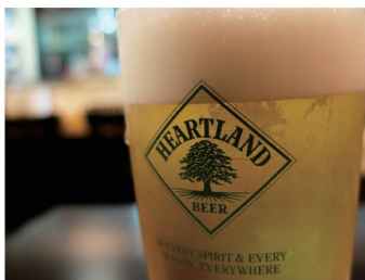
最初の一杯はハートランドの生! ¥580