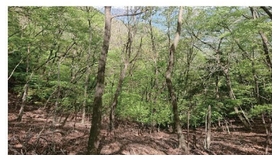
新緑が本当にきれいでした!