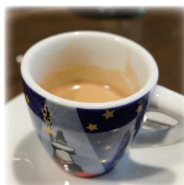
エスプレッソも ¥250 とお手頃