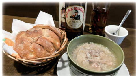
さっぱりしたビールとナンプレドット。¥890。軽くやるにはちょうどよい組み合わせ！