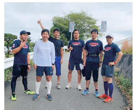
左から、安藤畳店・肉の富士屋 八王子資源・オータカ不動産・ コットンハウスタンノ・ミヤハラ