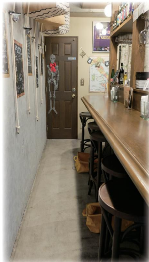
店内は8席、外にもテーブルあり。

壁には常連さんから譲り受けたイタリアサッカー選手「バジジョ」のユニフォームが！！