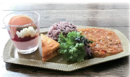
月替わりランチ。3月はカレーでした！野菜をアレンジしたサイドメニューもおいしい！