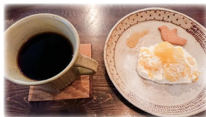
一杯一杯淹れてくれるコーヒーはとてもやさしく、かわいいデザートに花を添えています