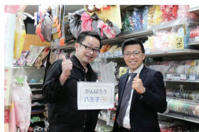
共に三代目、コロナに負けないようにがんばりましょう！！