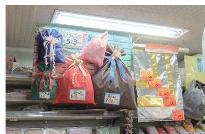
こんなラッピング例があれば、大きさ質感などもわかりやすいですよ♪