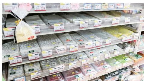
手作りお菓子などの小さいものもこんな袋でひと工夫。