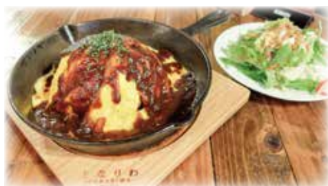
自慢のオムライスソースを選んでボリューム満点！アツアツのうちに召し上がれ！！