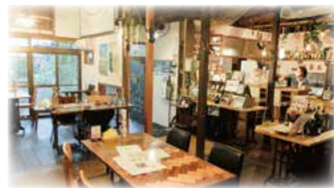
古民家を自分たちで改築して作った店内はとても居心地の良い空間です。テーブルの脚にも是非ご注目。。。♪