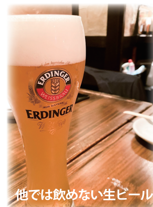
他では飲めない生ビール