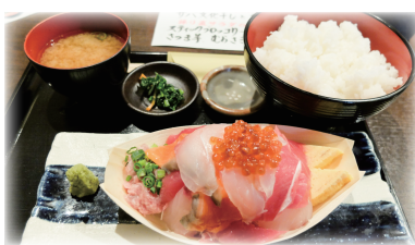
ランチの北前回船定食 このボリュームでなんと ¥880！