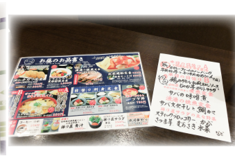
昼のランチもメニューが 豊富。とにかくボリューム 満点です！