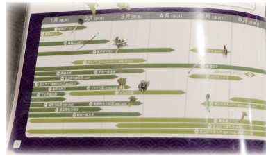
旬の目安がすぐわかるカレン ダー。東京の野菜はどんなもの があるかも知ることができ ます