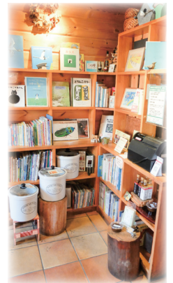
かわいい絵本がお出迎え