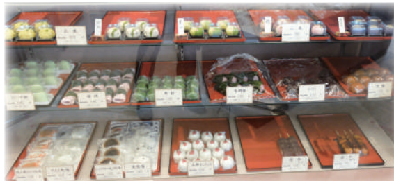
お店のケースには美味しそうな上生や朝生菓子が...!今日はどれにしようかな?!