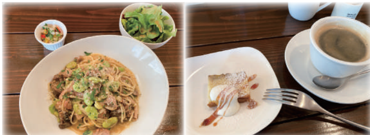
おすすめパスタランチ。この日は仔羊の空豆のラグーソース。味も組み合わせもちよっと他店とは違います。デザート&コーヒー付きで¥1,350で…。コスパ良すぎ！