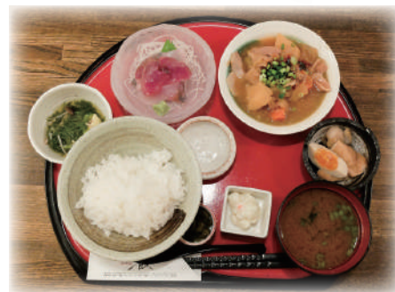
肉じゃがと刺身の

中町公園の北側向かい、大きい提灯が目印の『我飯(わがまんま)』さん。オープンして24年になる老舗の和風居酒屋さんです。この営業年数がお店評判の証拠。刺身・揚げ物・煮つけなど、定番からアレンジされた和風の小皿はどれをつついてもおいしく、つついとお酒も進みがち。「八王子のみなさんから愛されるお店でいつづきたいですね。私自身も食べるのが好きなので休日は外食して楽しみながら情報収集をしています。」