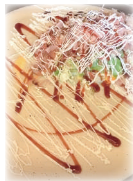
未知の領域! お好み焼きクレープ