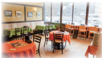
宴会やパーティーにも