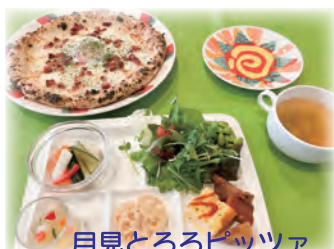
月見とろろピッツァ ビュッフェセット¥2,134