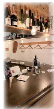
くの字カウンターの 魅力