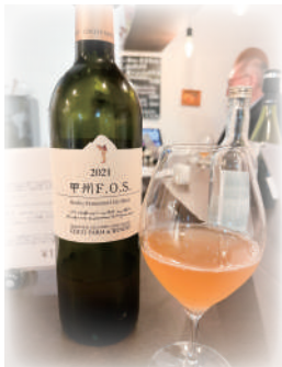
6月のおすすめワイン