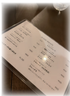
ワインに合わせた サイドメニュー