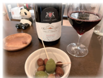
大好きなオリーブと月