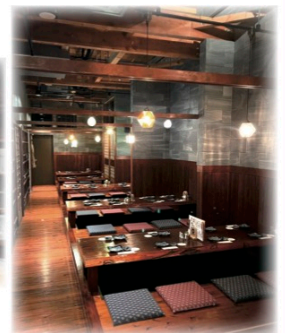
レトロモダンな客席