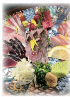
魚の鮮度は 間違いなし