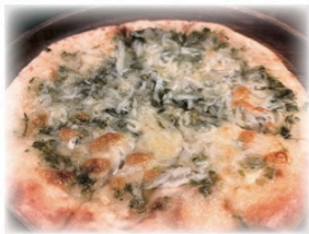
しらす入りピザ おすすめです