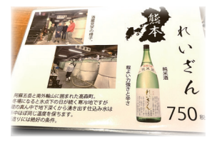
日本酒も親切な説明が あるのでうれしいですね