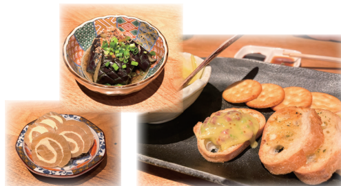
一品盛りのお料理はどれも おすすめ 酒のつまみにどうぞ