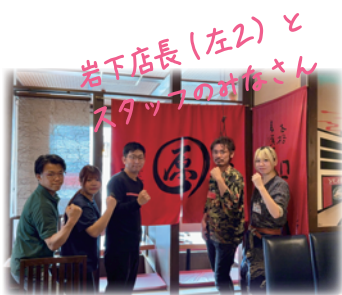
岩下店長(左2)とスタッフの皆さん